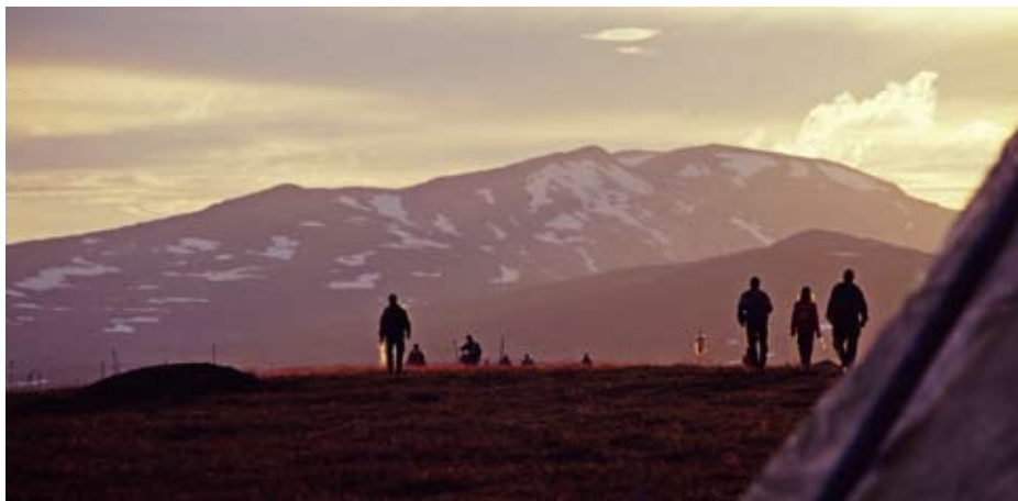
Kalvmärkning i Julimånad.

Det finns visserligen kvinnliga husbönder men för det mesta är det männen som har mest renar, flest röster och därmed störst makt i samebyarna. Visserligen har varje sameby möjlighet att göra självständiga tolkningar av lagen. Men många samebyar håller sig fortfarande till lagstadgad och etablerad praxis, när det gäller samebyns interna beslutsprocesser.