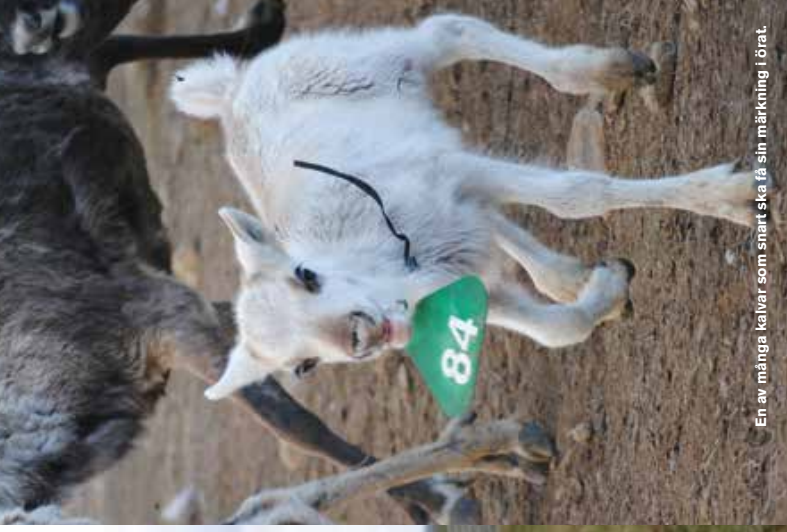
En av många kalvar som snart ska få sin märkning i örat.