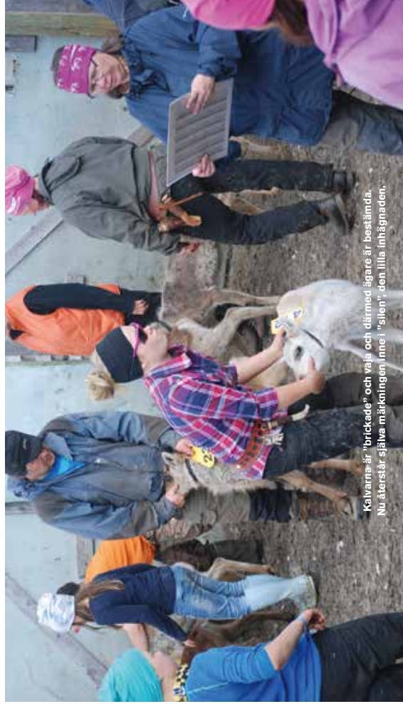
Kalvarna är "brickade" och vaja och därmed ägare är bestämda. Nu återstår själva märkningen inne i "silen", den lilla inhägnaden.