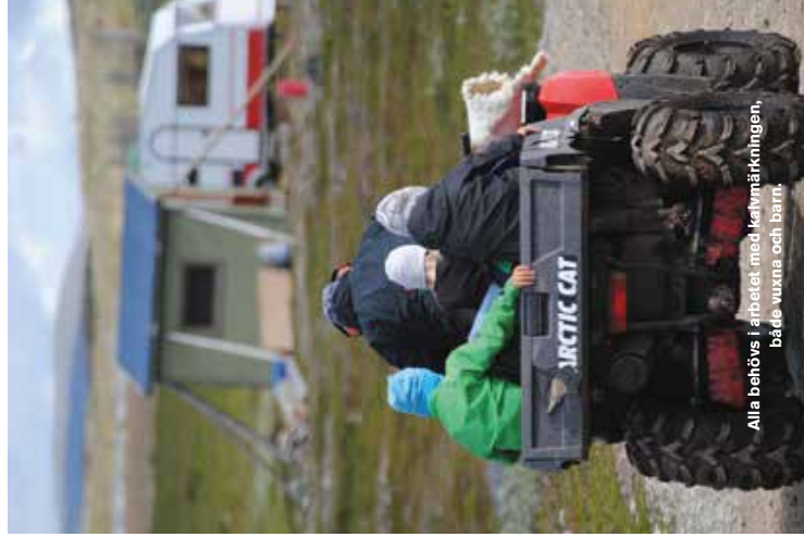
Alla behövs i arbetet, med kalvmärkningsen, både vuxna och barn.