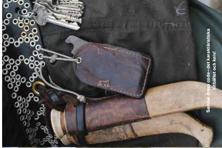
Samisk dress code - det karaktäristiska nitbältet och kniv.

"Trots att vi har alla motorfordon så går det inte att flytta renen om den inte själv vill. Det ligger i deras gener att de ska upp till fjället på våren. Vajorna vill kalva på samma ställe."